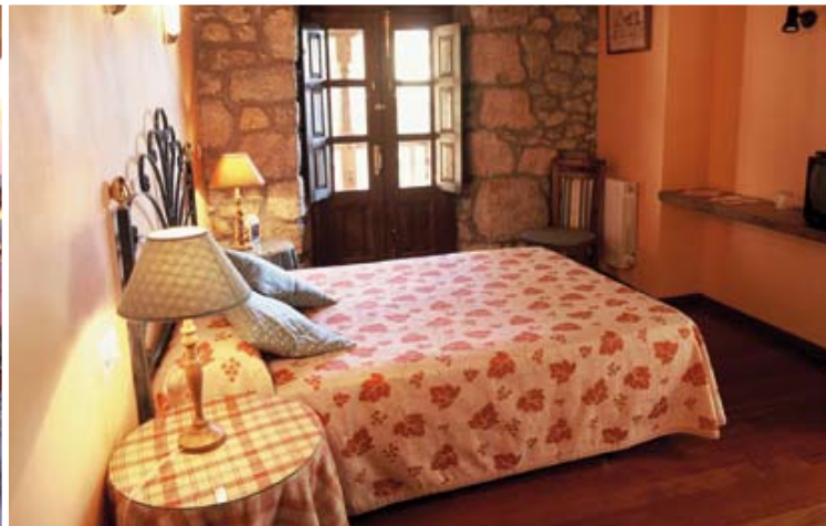
En Can Gasparó (fotos superiores e inferior izquierda) y la Posada del Valle (abajo, derecha), se respira un ambiente rústico, que favorece el descanso y la conexión con la naturaleza que buscan muchos de los clientes que acuden a los establecimientos de turismo ecológico.