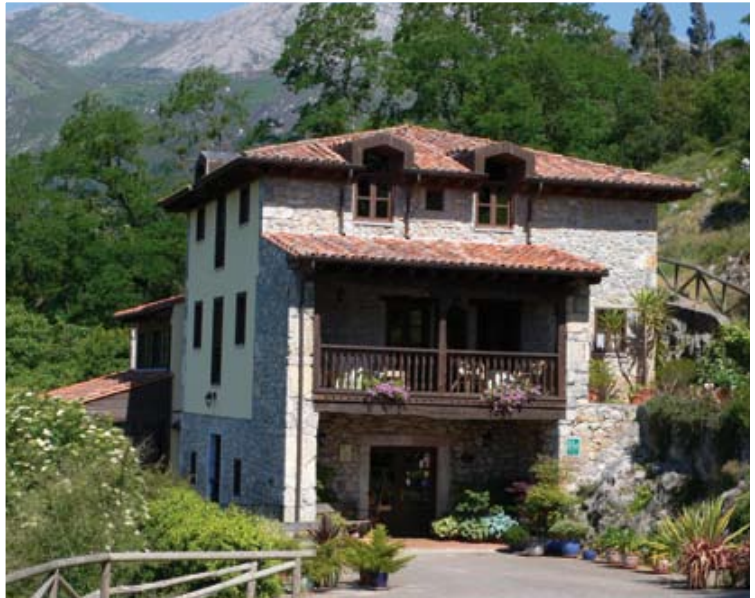
El edificio de Can Gasparó, en Girona (arriba y centro derecha), recibió el premio Pontos de construcción ecológica en la Feria de Frankfurt 2007. El aparthotel Venus-Albir, en Benidorm (centro, izquierda), se ha edificado con criterios geobiológicos y es el único en España con certificación Biohotel. Abajo, ovejas xaldas pastando en la finca ecológica de la Posada del Valle, Asturias, una casona de piedra y madera con espectaculares vistas a la montaña.